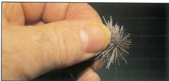
7/ Poser une deuxième pincée de poils devant la première en la serrant pour l'ébouriffer, puis une troisième si nécessaire pour arriver à l'oeillet.