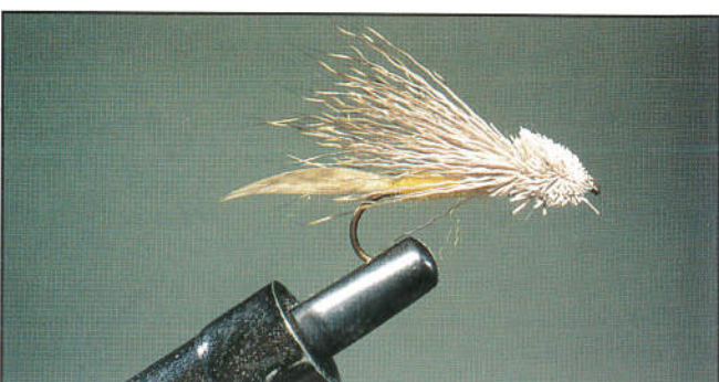
9/ Il ne reste plus qu'à raser la tête en forme de cône sur le dessus, et à couper tous les poils sur le dessous pour dégager entièrement le corps jaune.