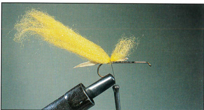
3/ Fixer une bonne pincée de polypropylène jaune.