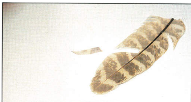
1/ Couper une lame dans la plume de faisane.

Fil de montage noir ; corps polypropylène jaune vif ; tête chevreuil naturel ; queue secondaire d'aile de faisane ; hameçon pour streamer T/8, 10 et 12.