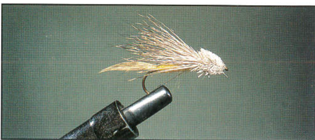
8/ Terminer la mouche par un whip-finish.