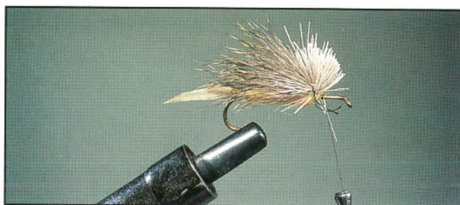
6/ Fixer la pincée de chevreuil, sans la laisser s'ébouriffer autour de la bampe.