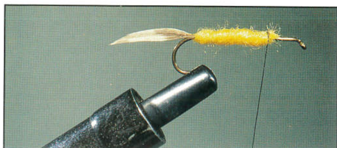
4/ Tourner un corps assez dodu.