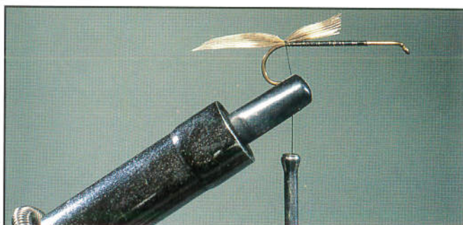
2/ Garnir la bampe de fil de montage, à la courbure fixer la lame de faisane.