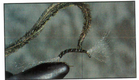
3) Couper les excédents de tinsel et de quills. Fixer 2 herls de paon à la limite de l'abdomen et quelques filaments de polypropylène rabattus vers l'avant avec la soie de montage.