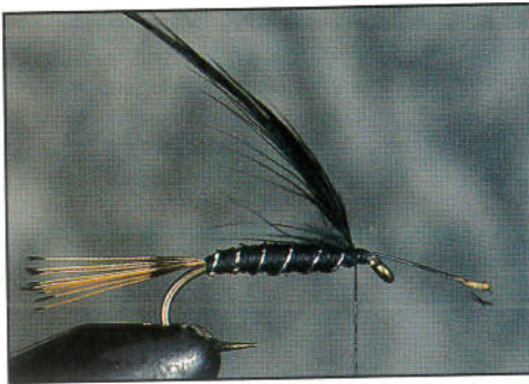
3) Fixer le hackle de poule face brillante vers l'oeillet.