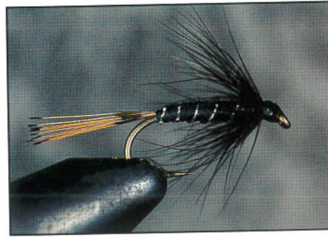
4) Tourner le hackle 3 à 4 fois. Former la tête avec quelques enroulements de soie. Noeud final, vernis.