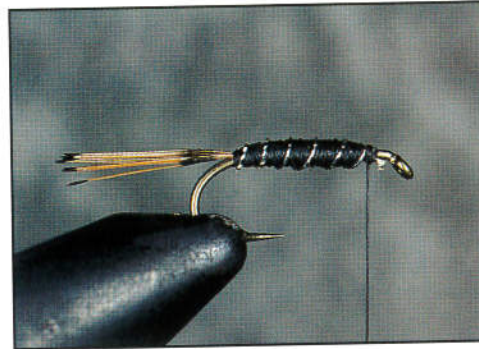
2) Former le corps avec la soie de montage et cercler avec le tinsel.