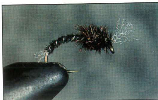
4) Enrouler le paon pour former le thorax. Couper les excédents de herls et de polypropylène. Réaliser le noeud final sous le pinceau de fibres de polypropylène. Vernis.