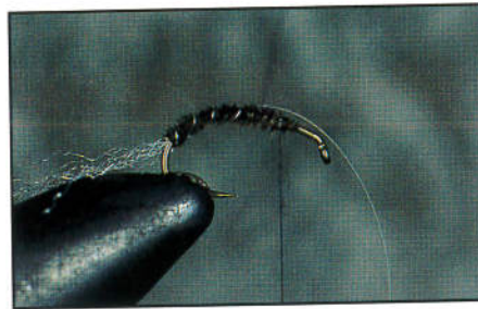
2) Enrouler les quills d'oie pour former l'abdomen. Rabattre le tinsel perle sur l'abdomen et l'emprisonner avec le tinsel argent.