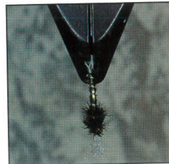
5) Vue de dessus.