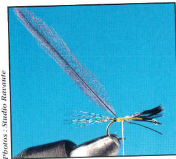
1) A l'aide de la soie de montage, fixer les cerques de pardo à la courbure. Fixer également le backle par le rachis préalablement ébarbé.

MATERIAUX : Hameçon: Kamasan B 405 N°10 à N°18. Soie de montage: jaune 8/0 (autres versions : olive, rouge, marron, or, argent, bordeaux) Cerques: fibres de pelles de pardo medio. Hackle: gris cendré naturel (coq limousin). Aile: pointes de plumes de cul de canard (colvert gris. le nombre de plume utilisé varie selon la taille de l'hameçon (6 pour #10, pour #18) Tête: fil marron 14/0 + vernis.